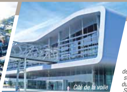
Cité de la voile