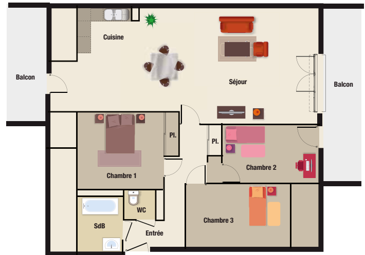
T4 Surface habitable : 70 m 2 (modèle) Balcon : 14,50 m 2